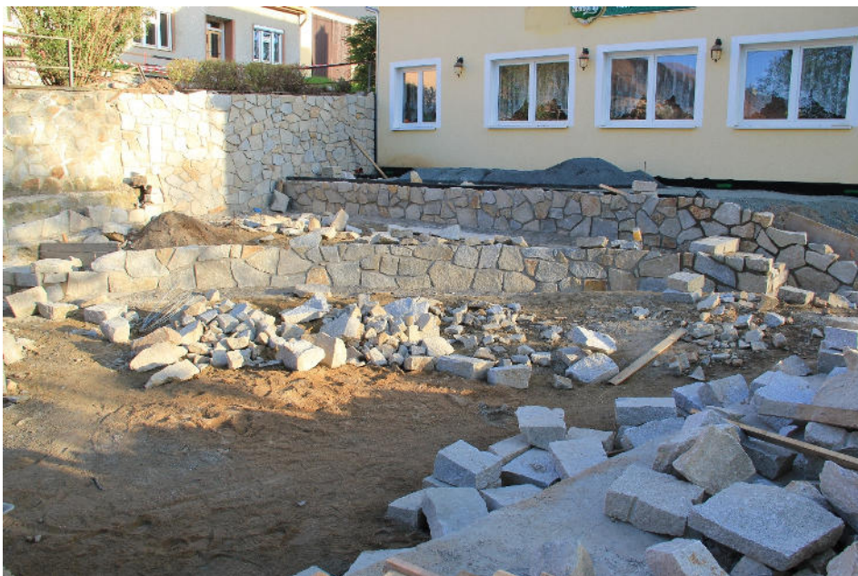
Úprava náměstíčka „U Rybníčka“ v Ořechevických