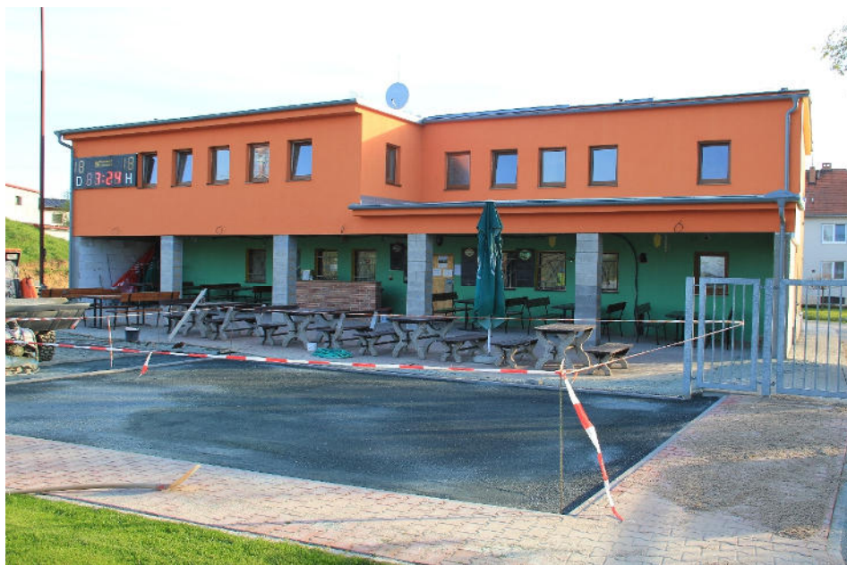
Rekonstrukce a přístavba kabin na stadionu