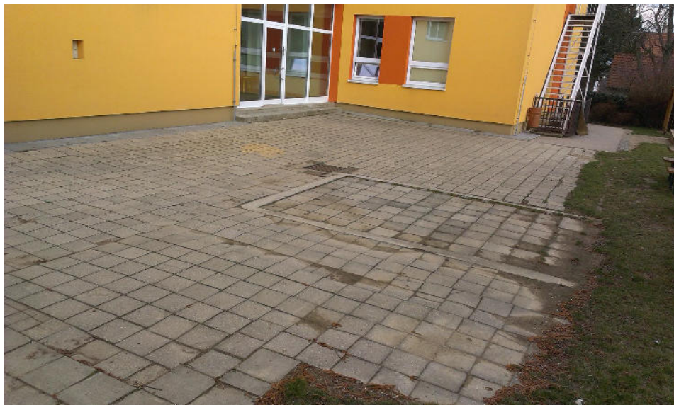
Prostor zahradní části mateřské školy před úpravou