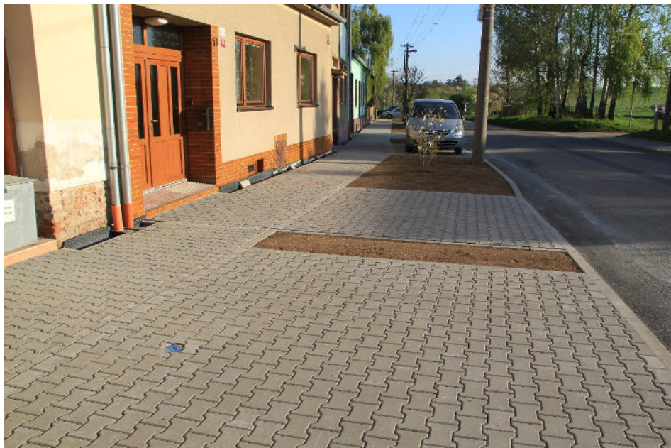
Nový chodník na ulici Brněnská