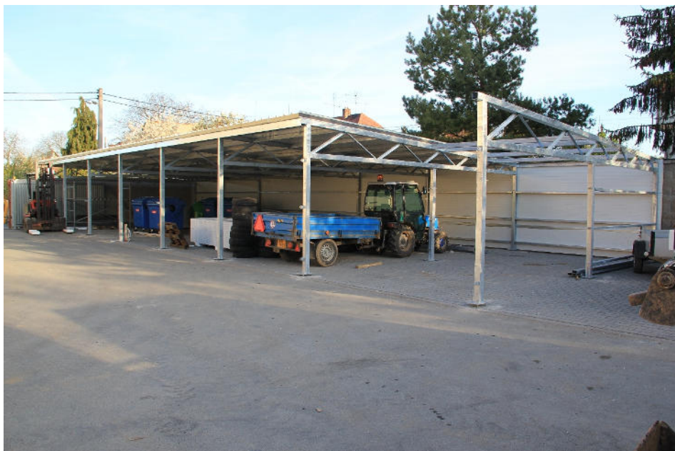
Nová hala na sběrném dvoře