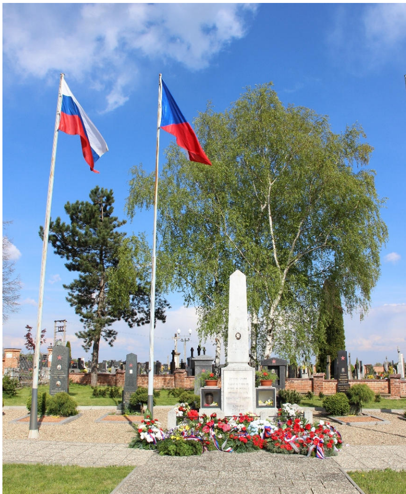
Mohyla na pohřebišti Rudé armády